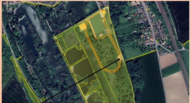
Emplacement se situant sur la parcelle communal AM 33, éloignée des habitations.

Date limite pour voter : mercredi 15 octobre